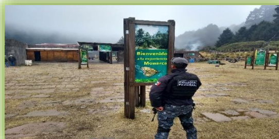
IMAGEN 25.- BIÓSFERA DE LA MARIPOSA