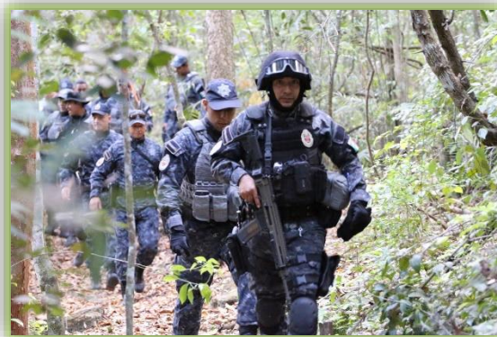
IMAGEN 29.- MISIÓN AMBIENTAL.