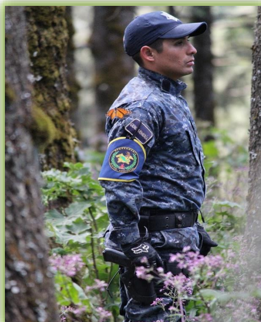
IMAGEN 30.- MISIÓN AMBIENTAL.