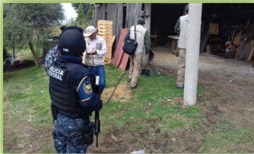
IMAGEN 12.- INSPECCIÓN A ASERRADEROS.