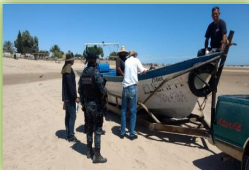
IMAGEN 20.- SEGURIDAD PERIMETRAL DURANTE LA INSPECCIÓN DE UNA PANGA.