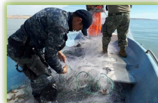
IMAGEN 16- HALLAZGO DE UNA RED.