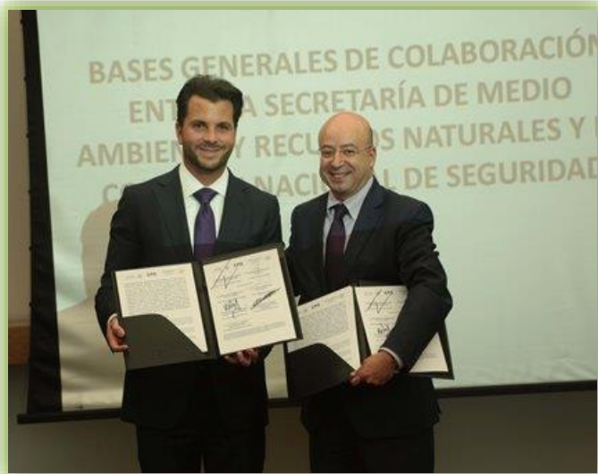
IMAGEN 1.- FIRMA DE CONVENIO.

El convenio nació por la necesidad de cumplir la normativa ambiental en recursos naturales, estableciendo como prioridad la conservación de la biodiversidad, combatiendo la tala ilegal, furtivismo, invasiones, tráfico de especies y otros actos de delincuencia comunes en estas áreas.