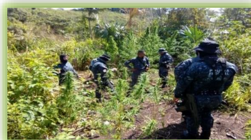
IMAGEN 28.- DESPLIEGUE CALAKMUL. CAMPECHE.