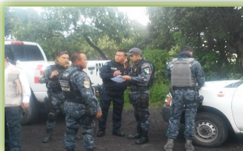
IMAGEN 23.- COORDINACIÓN EN EL OPERATIVO AJUSCO.