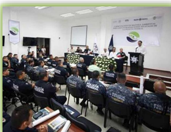
IMAGEN 7.- CAPACIÓN EN MATERIA AMBIENTAL.