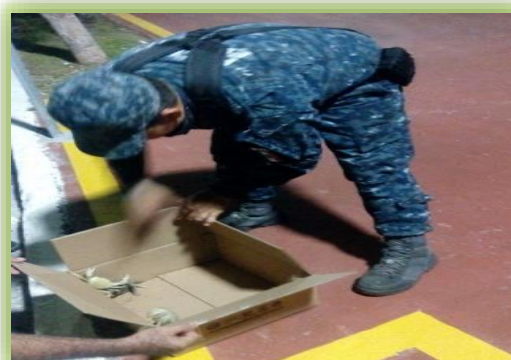
IMAGEN 11.- CANGREJO AZUL.