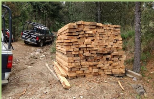
IMAGEN 18.- ASEGURAMIENTO DE MATERIA PRIMA.