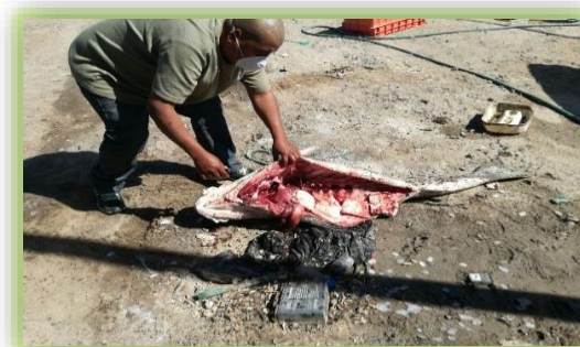
IMAGEN 15- HALLAZGO DE UNA TOTOABA SIN VIDA.

A fin de sumar esfuerzos en el fortalecimiento a la prevención de delitos ambientales en la Biósfera Alto Golfo de California y Delta del Río Colorado, el 23 de marzo del 2017, la División de Gendarmería despliega personal en el Estado de Sonora, sumando y realizando acciones táctico operativas, destacándose los patrullajes en CRP, a pie tierra, aéreos (sobrevuelos), puntos de inspección, inspecciones vehiculares, a embarcaciones y seguridad perimetral.