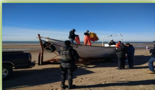
IMAGEN 24.- HALLAZGO DE UNA RED CAMARONERA.