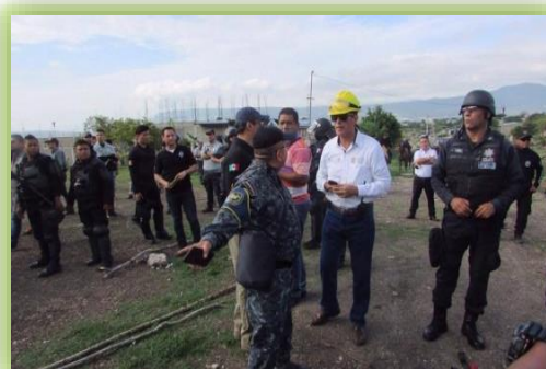
IMAGEN 21.- COORDINACIÓN EN EL OPERATIVO CAÑÓN DEL SUMIDERO.