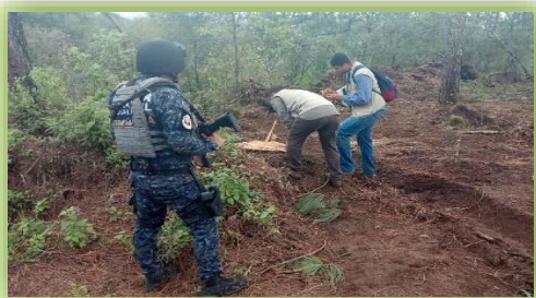
IMAGEN 22.- INSPECCIONES FORESTALES.