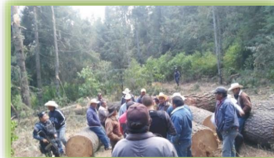
IMAGEN 27.- MIGRACIÓN DE LA MARIPOSA MONARCA.

Aunado a lo anterior de manera coordinada con otras instancias se ha logrado el aseguramiento de diversa materias primas, la clausura y aseguramiento de Centros de