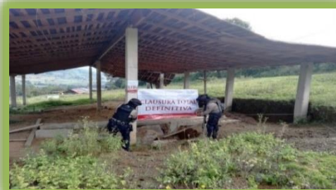
IMAGEN 9.- CENTRO DE ALMACENAMIENTO CLAUSURADO.

Se llevó a cabo del 21 al 24 de septiembre de 2016 en el Estado de México, Morelos y la Ciudad de México, con la participación de las Divisiones Científica, Gendarmería y Seguridad Regional de la Policía Federal, en coordinación con SEDENA, SEMAR, PROFEPA, PROBOSQUE, CES (Cuerpo Estatal de Seguridad del Estado de México), SSP (Secretaría de Seguridad Pública de la Ciudad de México), PGJEM y el Mando Único del Estado de Morelos en coordinación con la PROFEPA a fin de inhibir la tala clandestina.