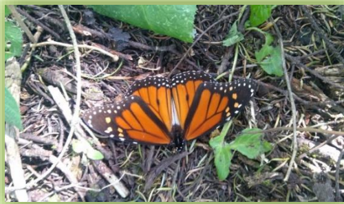
IMAGEN 26.- MARIPOSA MONARCA

Al mes de octubre del 2018, se han realizado 1,324 acciones táctico operativas , destacando patrullajes en CRP, a pie tierra y a caballo, seguridad perimetral, inspecciones vehiculares y aserraderos, entre otros.