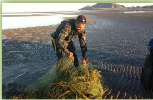
IMAGEN 14. HALLAZGO DE UNA RED CON RESTOS DE TOTOABA.