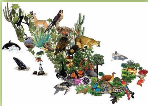
IMAGEN 8.- VIDA SILVESTRE.

Con más de mil 300 elementos, la Gendarmería ya tiene presencia en