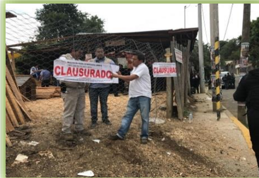
IMAGEN 17.- CLAUSURA DE UN CENTRO DE ALMACENAMIENTO.