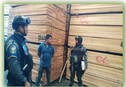
IMAGEN 10.- ASEGURAMIENTO DE MADERA.