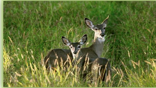
IMAGEN 13.- VENADO COLA BLANCA.