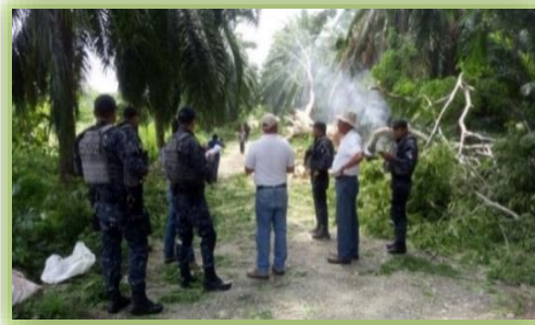
IMAGEN 19.- COORDINACIÓN CON OTRAS AUTORIDADES.