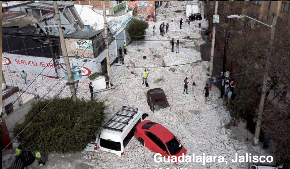
Guadalajara, Jalisco (2019)