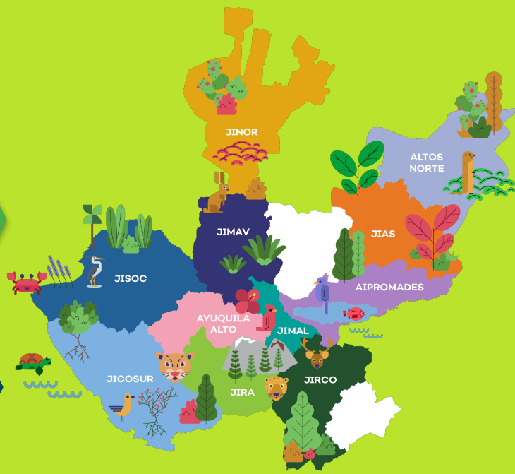
Mapa de Jalisco y las Intermunicipalidades, 2020.