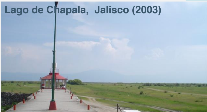
Lago de Chapala, Jalisco (2003)