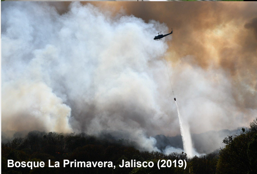
Bosque La Primavera, Jalisco (2019)